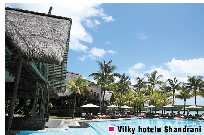
Vilky hotelu Shandrani

Pro ty, kdo už nemají hlad a chtějí něco jiného než moře, slunce a písek, se nabízí cesta do centra ostrova. Najdete zde krásné scenerie i mnoho možností pěší turistiky. Jednou z nejlepších nabídek je národní park Black River