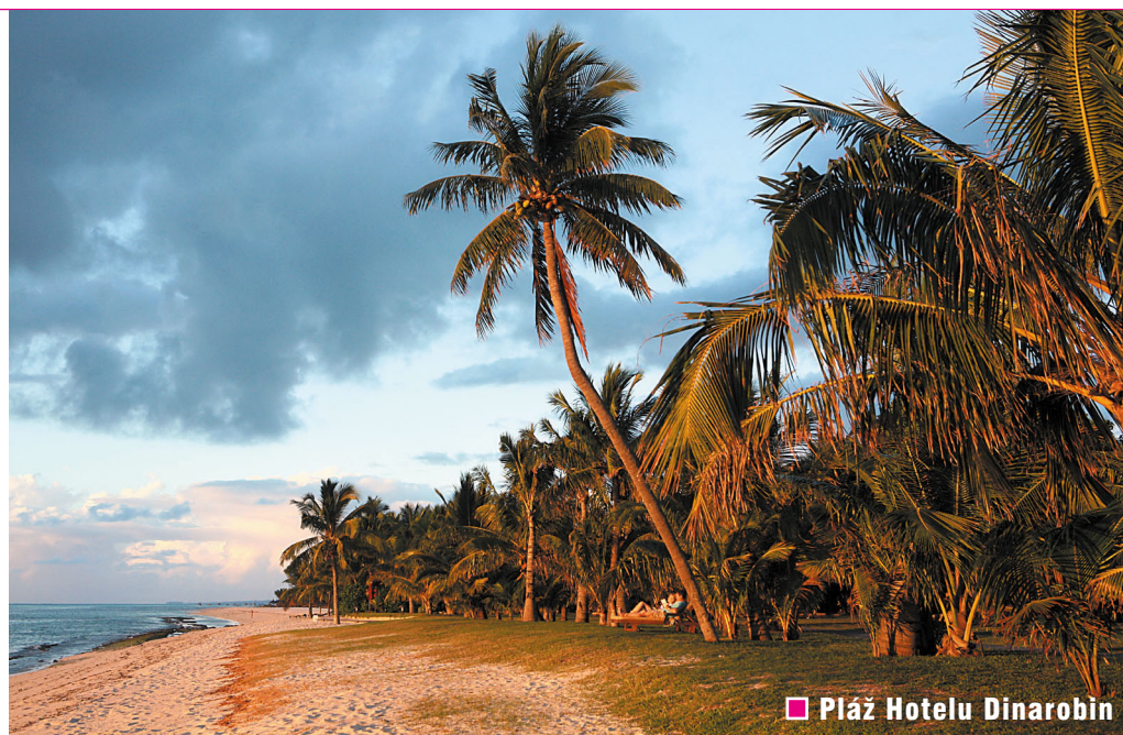
Pláž Hotelu Dinarobin

Po celonočním letu přistáváme a přesouváme se do luxusního hotelu Shandrani. Leží na vlastním poloostrově, který vytváří lagunou Blue Bay se dvěma chráněnými a jednou divokou pláží otevřenou vlnám oceánu. Je to komplex vilek, bazénů a restaurací, ve kterém strávíme první dva dny. Vzhledem k malému