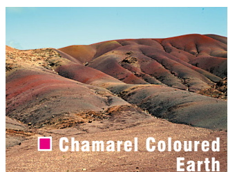
Chamarel Coloured Earth

Mauricius, Mauricius už jen to jméno voní dálkou, kývajícím se palmami, bílými plážemi a zlatým sálajícím sluncem.