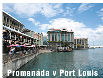
Promenáda v Port Louis

S jeho 180 000 obyvateli je jistě nejživějším centrem ostrova. Vysoké skály obepínající město, které kdysi byly přirozenou ochranou přístavu před větrem, tvoří dnes jen dramatické panorama. Přeplněné tržiště, obchodní budovy a nezvladatelné silniční zácpy, tím se tato lokalita neliší od mnoha rovníkových metropolí. Co je zde ale výjimečné, je jeho neopakovatelná multikulturnost. Protože se zde v průběhu staletí usadili Francouzi, Angličané, dovezení afričtí otroci a posléze Indové a Číňané, je toto město směsicí ras