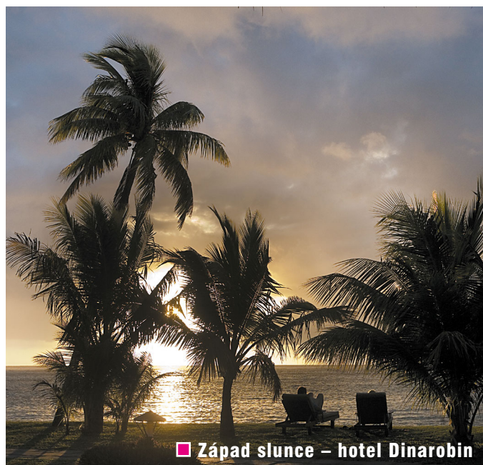
Západ slunce - hotel Dinarobin

Port Louis má lákavou nabídku barů, restaurací a kaváren. Možnosti nakupování jsou neomezené. Můžete hodiny lelkovat v klimatizovaných galeriích s množstvím módních butiků nebo se prodírat zaprášeným a zpoceným tržištěm a nechat se přesvědčovat od ukřičených prodejců, že tyto rolexky jsou zaručeně pravé. Zavítat můžete i do místních muzeí, z nichž nejzajímavější je Blue Penny Museum. Tato ultramoderní budova má exponáty, o kterých slyšelo snad každé malé dítě, a při vyslovení jejich názvu se většinou filatelistů podlomí kolena. Červený a modrý Mauricius, dvě legendární známky, které byly vytištěny již před více než 160 lety a jejichž cena je neuvěřitelná.