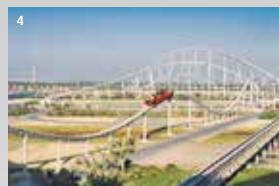
4 F1 World Park