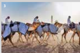
3 Velbloudí závody