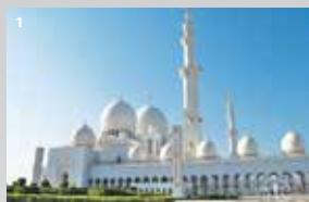
1 Sheikh Zayed Grand Mosque